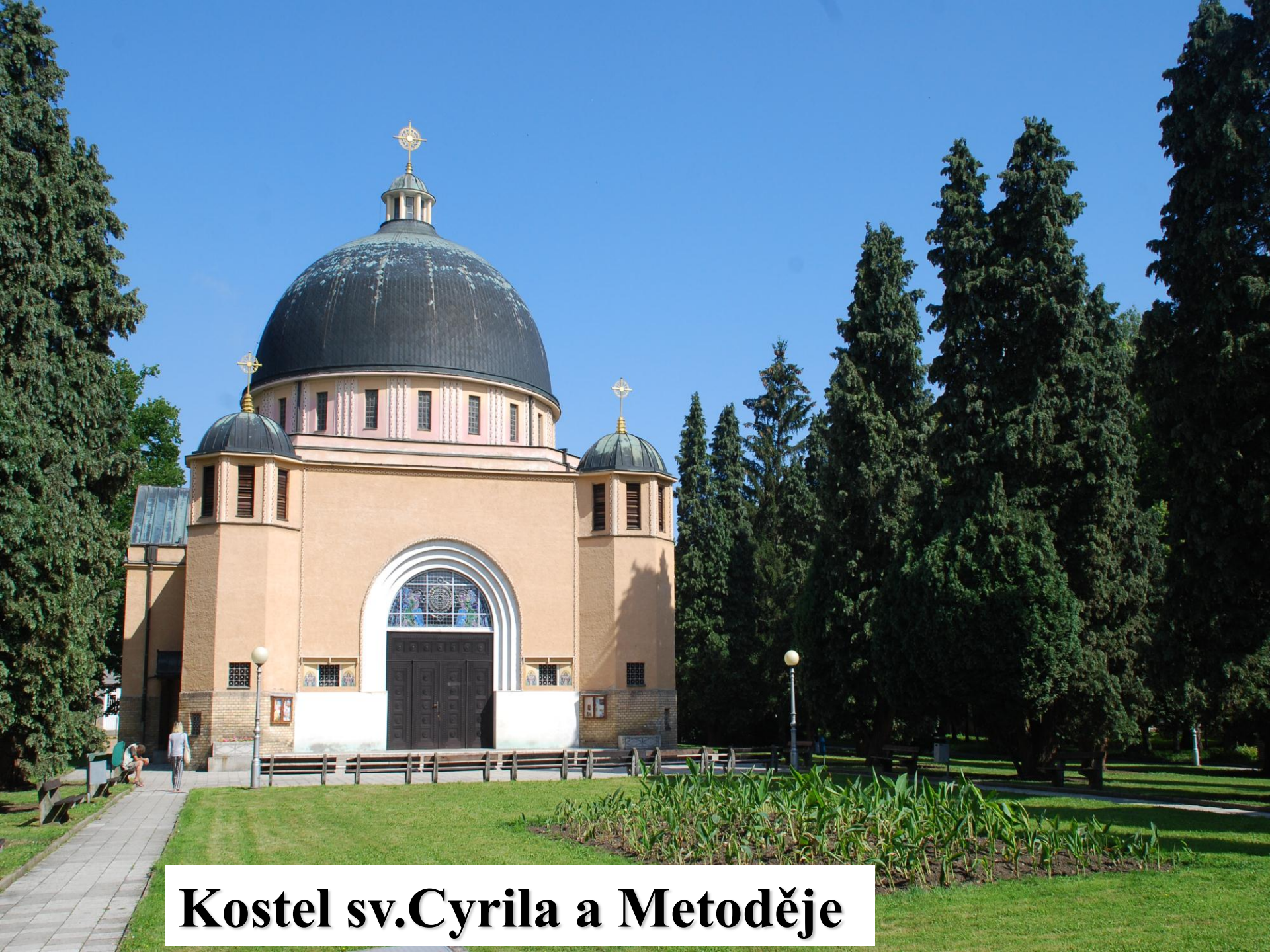
Kostel sv. Cyrila a Metoděje